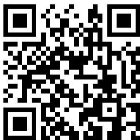
フォームから応募